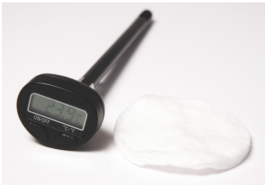
Abb. 3: Materialien für eine Schülergruppe, beispielhafte Abbildung