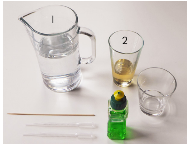
Abbildung 2: Benötigte Materialien. 1: Wasser, 2: Speiseöl.