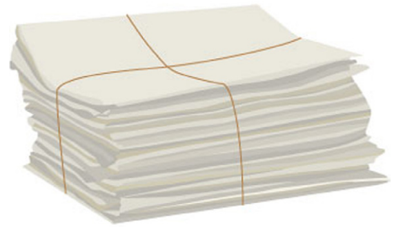
Abbildung 1: Ein Stapel Altpapier.

Deine Schwester Mia malt ein Bild auf ein Blatt Papier. Sie findet das Bild nicht sehr schön und will es gleich in die Papiertonne schmeißen. Da sagst du zu ihr: „Aber Mia, das ist ja totale Papierverschwendung! Du könntest auf der hinteren Seite nochmal ein Bild malen oder du überlegst dir, was du mit dem Papier basteln kannst. Wir können z. B. aus altem Papier Sandalen bauen. Soll ich dir zeigen, wie das geht?“