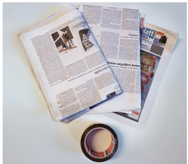
Abbildung 2: Benötigte Materialien.