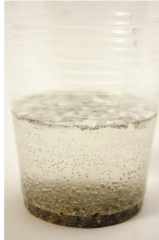
Abb. 1: Unsere Sand-Kunststoff-Wasser-Salzmischung.