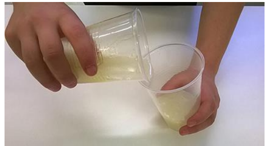
Abb. 2: Was geschieht beim Dekantieren?