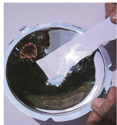
Abb. 3: Brennpunktsuche.