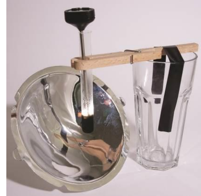
Abb. 4: Klebeband und großes, schweres Trinkglas als Stativersatz.