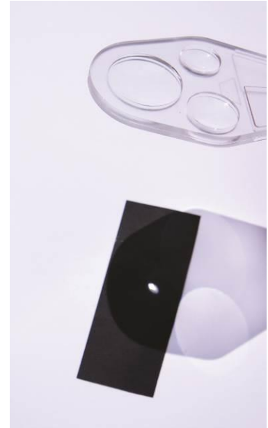
Abb. 2: Erzeugen des Brennpunkts und Entzünden des Papierstreifens.